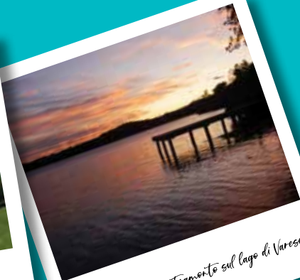
Tramonto sul lago di Varese