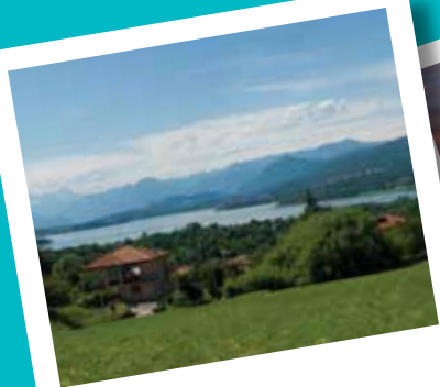
Panorama lago di Varese