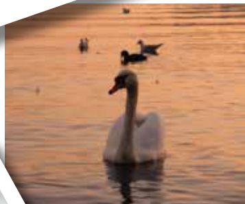
Cigno sul lago di Varese