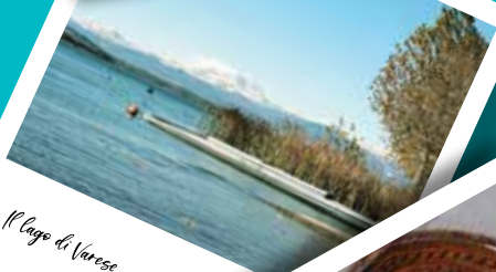
Il lago di Varese